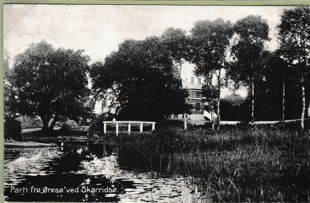
Parti fra Øresø ved Skarriidsø.